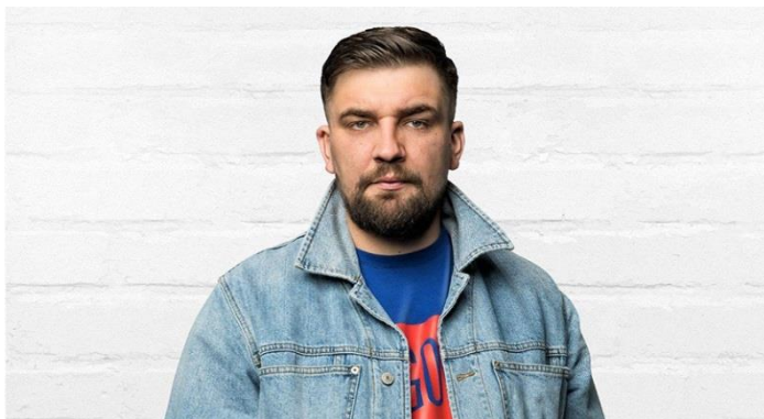
Константин Николаевич Лавроненко

«Я горжусь, что я ростовчанин и до сих пор прописан там, где я родился и жил. Я настоящий фанат и поклонник своего города», – сказал Баста в программе «101 вопрос взрослому».