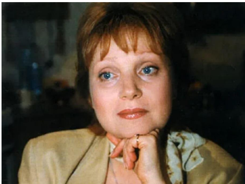
Ирина Александровна Аллегрова