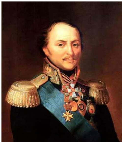
Семен Михайлович Будённый

Великий советский военачальник, один из первых маршалов Советского Союза, трижды Герой СССР, кавалер Георгиевского креста всех степеней Семен Буденный родился в хуторе Козюрин Сальского округа Ростовской области.